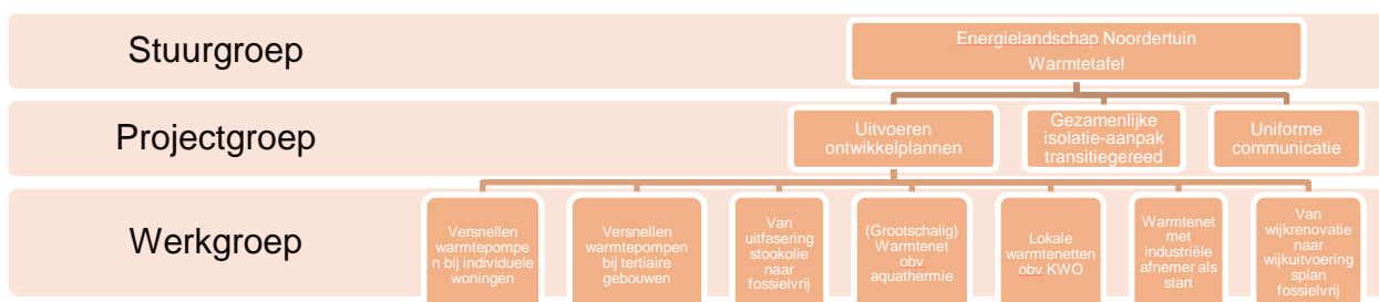
Figuur 1 Organisatie Noordertuin-brede samenwerking

Om ervoor te zorgen dat de bevindingen en resultaten uit de ontwikkelplannen en pilotprojecten leiden tot een effectieve versnelling van de warmtetransitie, moeten ze geïntegreerd worden in de reguliere werking van de gemeente. Daarvoor is het nodig dat een structuur binnen de gemeente wordt opgezet waarin een duidelijke trekker ( coördinerend ambtenaar ) wordt aangeduid die de instrumenten die binnen de stuurgroep Noordertuin zijn goedgekeurd vertaalt naar de eigen gemeente. Per betrokken dienst wordt een ambtenaar aangeduid die het warmteplan mee opvolgt voor zijn/haar dienst en verantwoordelijk is voor de acties die op zijn/haar dienst betrekking hebben.