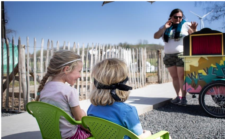
© De Verhalenweverij/ Griet van Wesemael