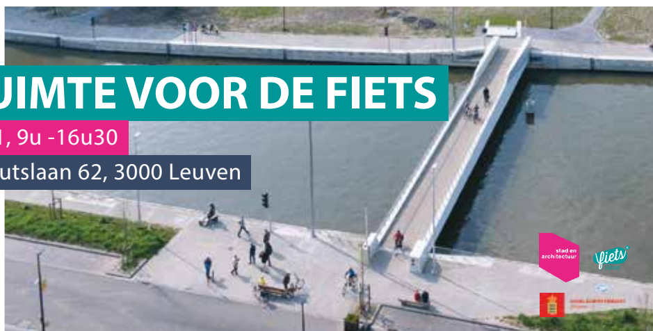
Bloemmolensbrug, Harelbeke | Landschapsarchitect: Bureau Bas Smets | Ontwerp: ZJA (architecturaal) en SBE (structureel)

Inschrijven en info via www.fietsberaad.be