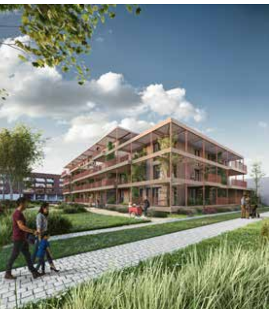
Fase vier 'Zen' is een voorbeeld van duurzaam ontwikkelen en ecologie.

H et ontwikkelingsgebied 4 Fonteinen strekt zich uit tussen de Schaarbeeklei – een zuidelijke invalsweg van Vilvoorde – en het Zeekanaal Brussel-Schelde, en tussen het Kanaalpark – een eerdere ontwikkeling vlak bij het stadscentrum – en het Viaduct. Het maakt deel uit van de grote Watersite-zone, een industriezone van 100 hectare die in een groene stadswijk aan het water moet veranderen. Xaveer De Geyter Architecten ontwikkelde hier in 2006 een stedenbouwkundige conceptstudie voor. Dit plan vormt tot op vandaag het vertrekpunt voor alle ontwikkelingen in de Watersite-zone en geeft een centrale functie aan het Zeekanaal, de Zenne en het park Drie Fonteinen.