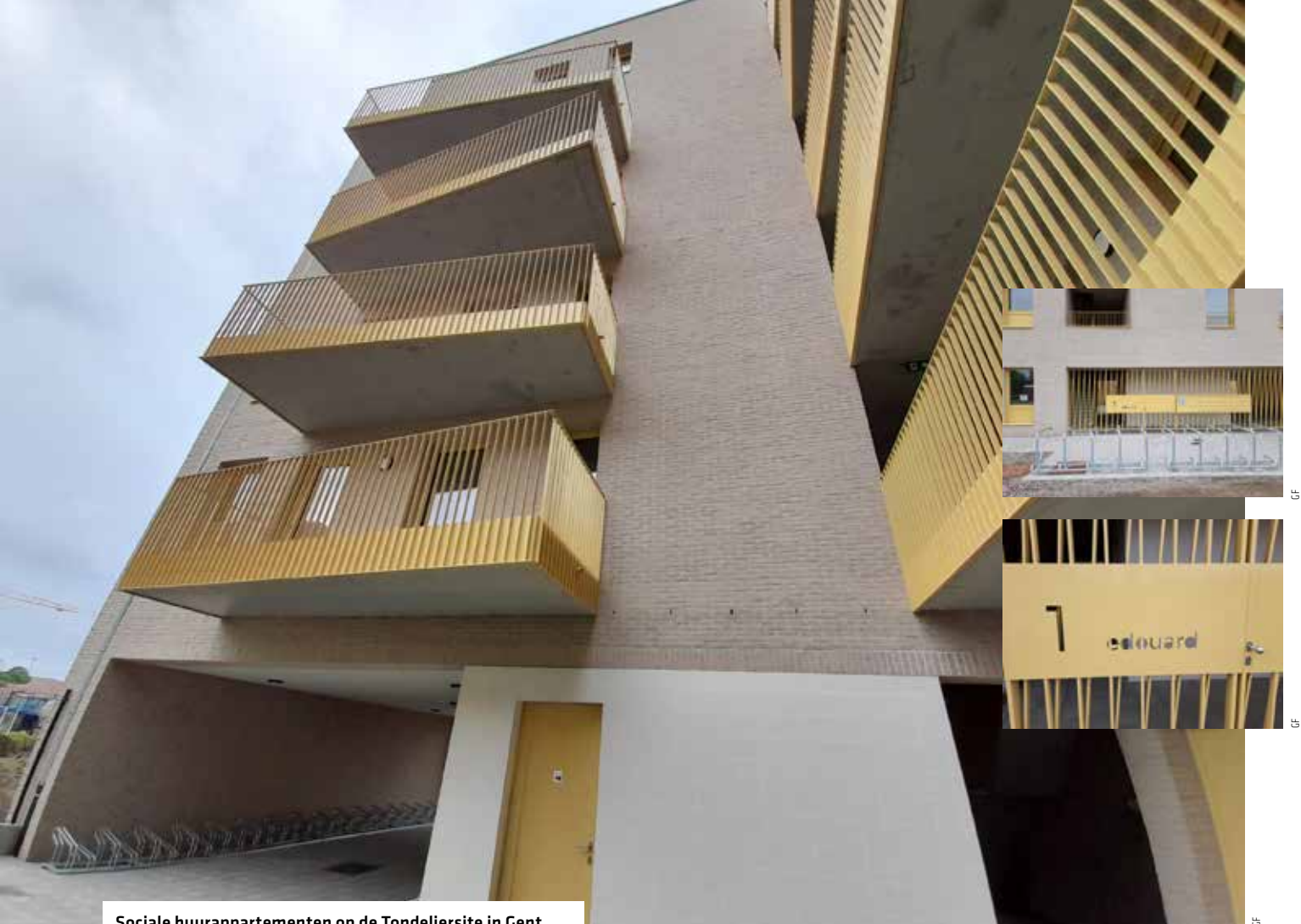
Sociale huurappartementen op de Tondeliërsite in Gent. Tondelië werd ontwikkeld in regie van de stad.