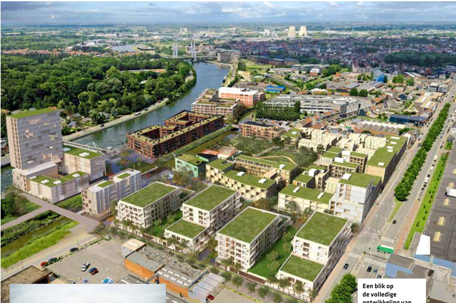
Een blik op de volledige ontwikkeling van 4 Fonteynen