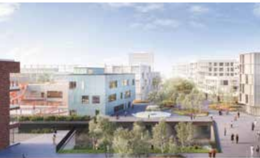
De school gelegen aan het Broekplein en de Zenne.