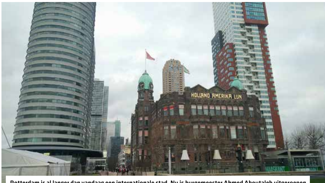
Rotterdam is al langer dan vandaag een internationale stad. Nu is burgemeester Ahmed Aboutaleb uitgeroepen tot beste burgemeester van de wereld, omdat hij alle inwoners als Rotterdammers behandelt.