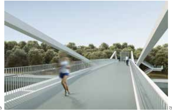
Visualisatie van de toekomstige fiets- en wandelbrug

collectieve binnengebieden. Het centraal gelegen Broekplein was als eerste klaar en is nu deels ingepalmd door de voorbereidende werken voor de toekomstige fiets- en wandelbrug over het Kanaal. Die brengt je vanaf 2022 in een mum van tijd naar het Domein Drie Fonteinen waar zich een ruim aanbod sportfaciliteiten bevindt. De nieuwe brug zal beweegbaar zijn, zodat het scheepvaartverkeer altijd door kan. Ook hier kiezen de stad en de Vlaamse Waterweg voor duurzaamheid, zowel qua ontwerp als qua productie. De brug wordt volledig gefabriceerd in het atelier van een staalbouwer en nadien over het water, per schip, naar Vilvoorde gebracht.