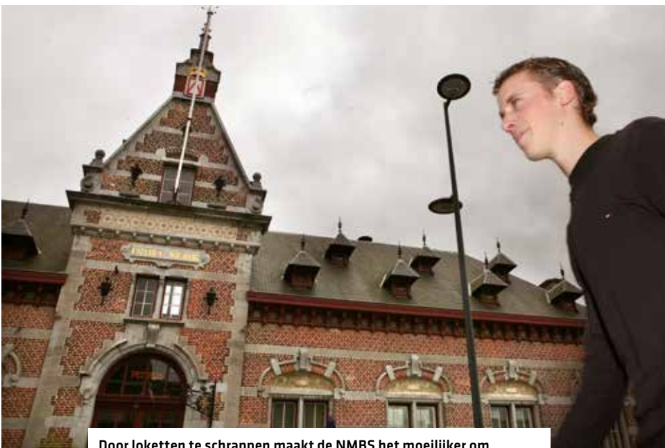
Door loketten te schrappen maakt de NMBS het moeilijker om iedereen een minimale basismobiliteit te garanderen.