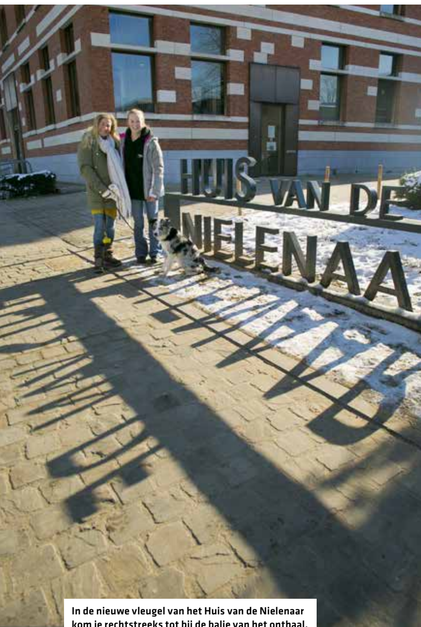
In de nieuwe vleugel van het Huis van de Nielenaar kom je rechtstreeks tot bij de balie van het onthaal.