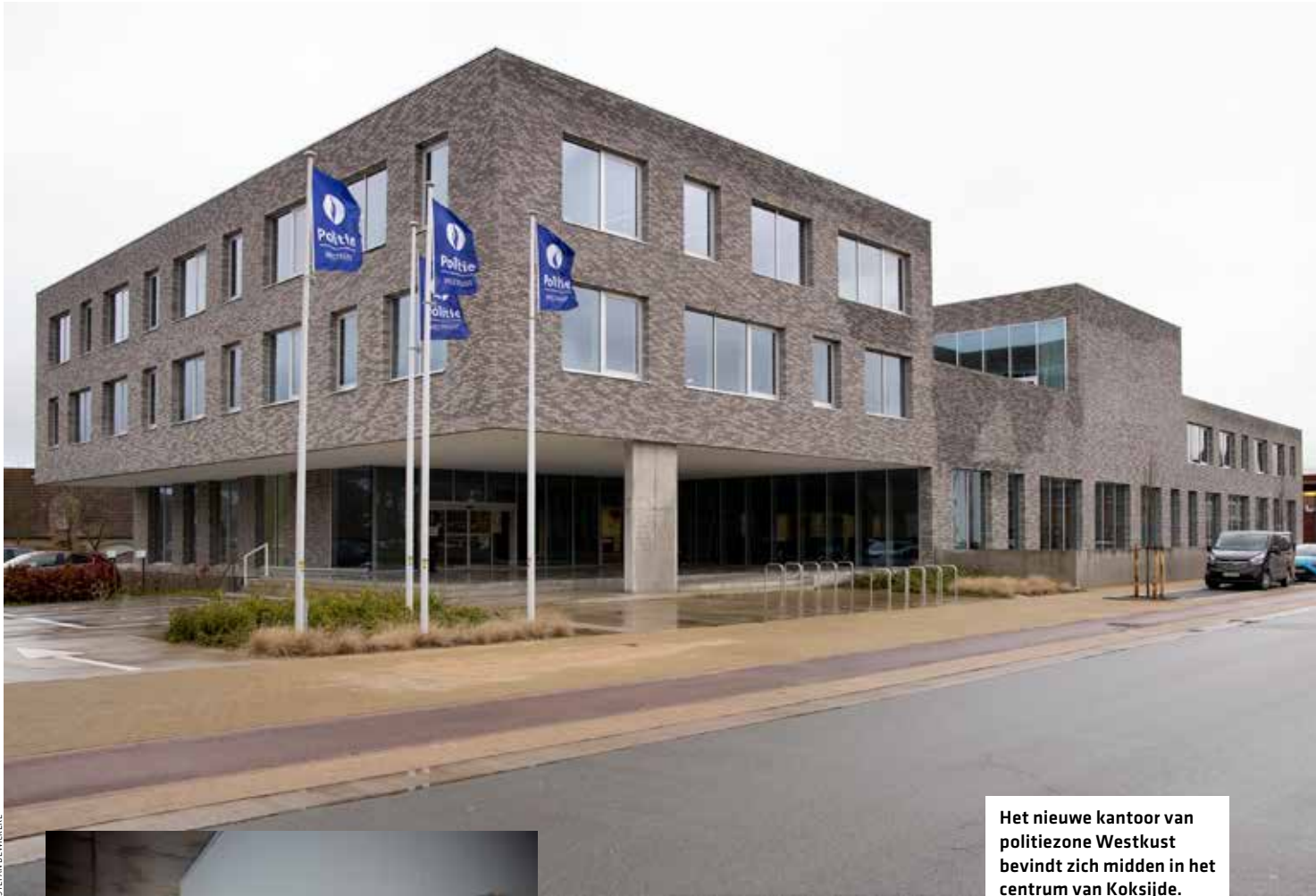
Het nieuwe kantoor van politiezone Westkust bevindt zich midden in het centrum van Koksijde.