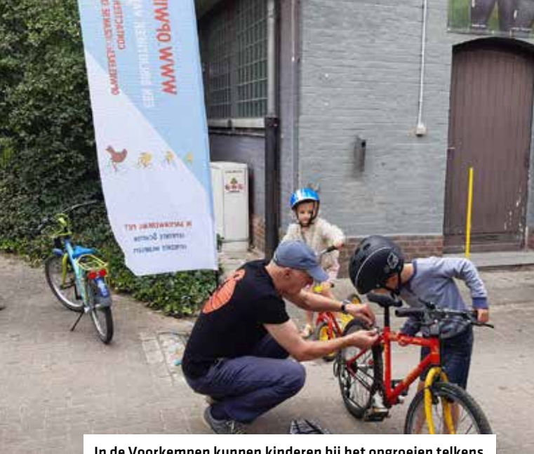
In de Voorkepen kunnen kinderen bij het opgroeien telkens een kinderfiets op maat inruilen bij Op Wielekes.

ties zoals technisch inzicht, materiaalkennis en sociale vaardigheden, waardoor ze sterker staan in hun zoektocht naar werk en een stap dichterbij een succesvolle doorstroming.