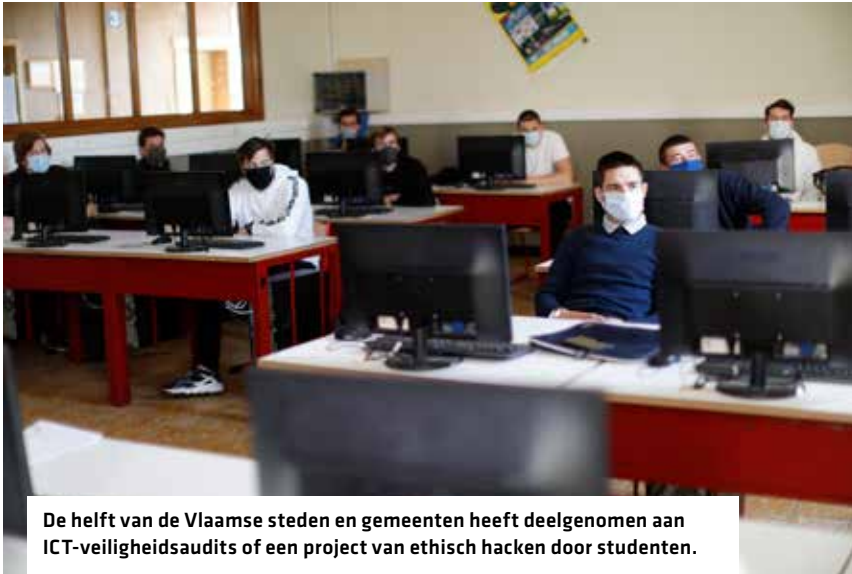
De helft van de Vlaamse steden en gemeenten heeft deelgenomen aan ICT-veiligheidsaudits of een project van ethisch hacken door studenten.