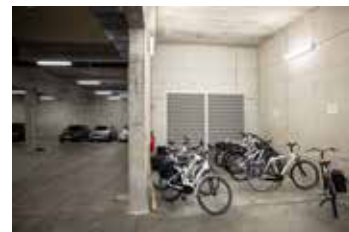
In de andere kelderverdieping zijn de garages met laadpunten.