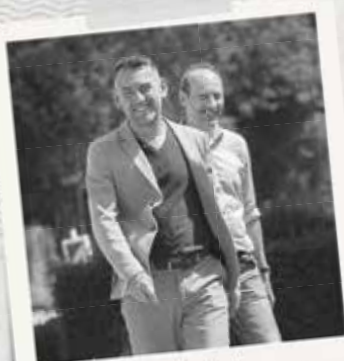
Team Lokale Kamer

ZET JOUW GEMEENTE OOK OP DE LOKALE OMBUDSDIENST- KAART!