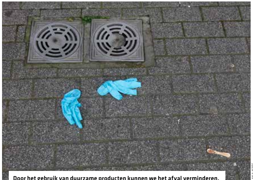
Door het gebruik van duurzame producten kunnen we het afval verminderen.