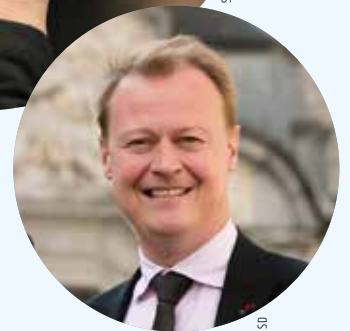
Christophe Peeters Ondervoorzitter van de Gemeenteraad en de OCMW-raad Stad Gent