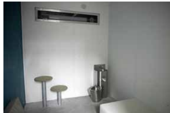
In de ene kelderverdieping bevinden zich de cellen voor arrestanten waar ze ook ondervraagd kunnen worden.

volgen die de drones, bodycams en helikopters uitzenden, niet alleen van de gemeenten uit de eigen politiezone maar in geval van ramp of nood ook die van de zones Polder, Riho en Vlas. Als er een kind op het strand verloren loopt, gaat dankzij deze hulpmiddelen geen kostbare tijd meer verloren, meteen vertrekken de drones op zoektocht over het strand. Bodycams zorgen dan weer voor betere bewijsvergaring, minder betwisting op de rechtbank, minder geweld op politie en ook minder uitschuivers van de politie zelf.