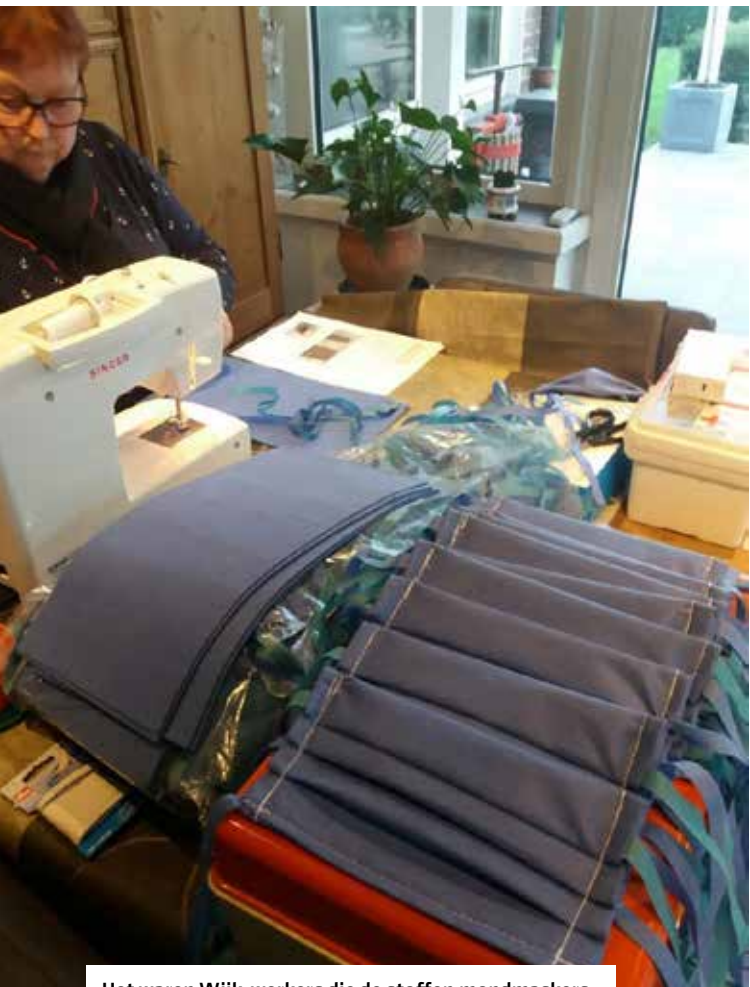
Het waren Wijk-werkers die de stoffen mondkmaskers hebben gemaakt voor het AZ in Turnhout.

jetons uitdeelden zodat ze konden nagaan of er niet te veel mensen op de markt waren. Ze keken ook toe op het naleven van de maatregelen zoals het dragen van een mondkmasker of het ontsmetten van de handen. Ze hielden ook de sanitaire blokken voor de marktkramers aangenaam en hygiënisch.